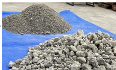
改質再生骨材 (LSC, LGC)