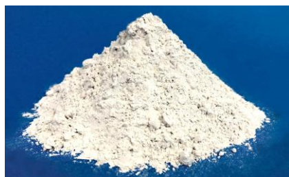
高炉スラグ微粉末