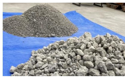
改質再生骨材 (LSC, LGC)

高炉スラグ微粉末を使用した再生骨材コンクリートの 強度・耐久性の改善方法の効果とそのメカニズム