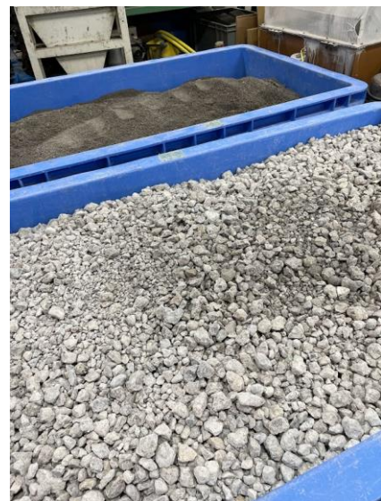
再生骨材 (LS, LG)